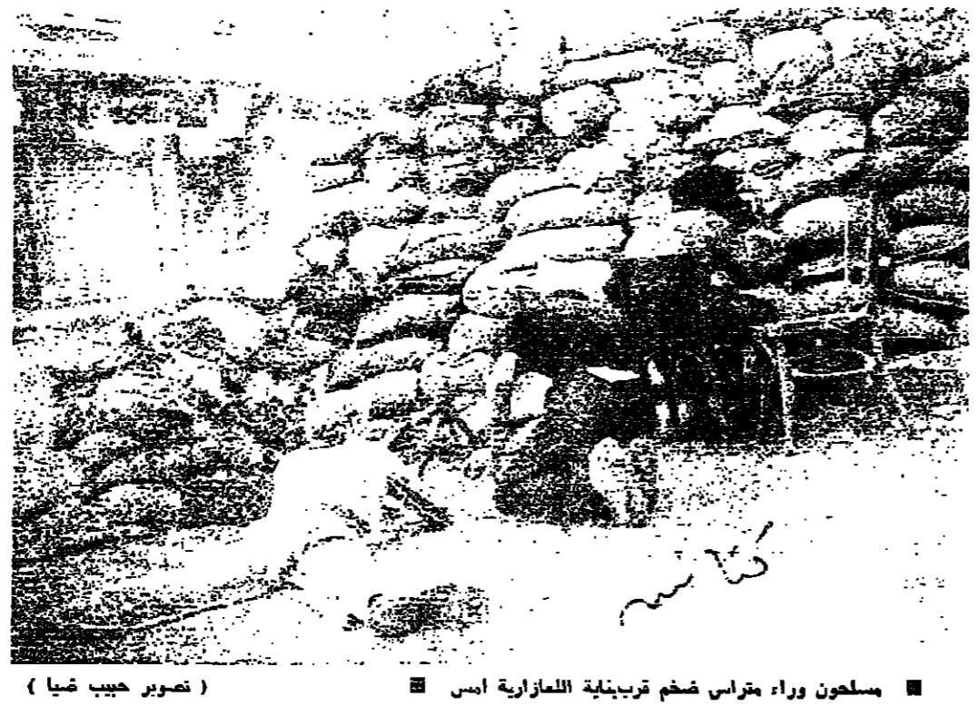
مسلمون وراء برامى ضخم قرب بناية للمعارضة امس